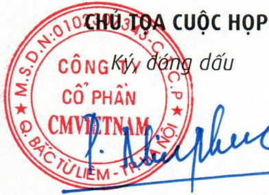
Phạm Minh Phúc

Phiên họp kết thúc vào hồi 11h cùng ngày, Biên bản cuộc họp được các thành viên tham dự thống nhất thông qua và ký tên dưới đây: